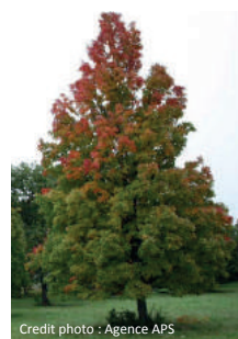
Acer Rubrum (Erable)