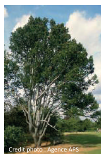
Pinus Bungeana (Pin Napoléon)