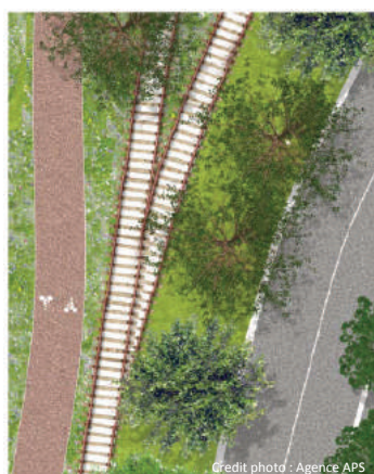
Voie modes doux de 3m de large, voie ferrée conservée, plantations